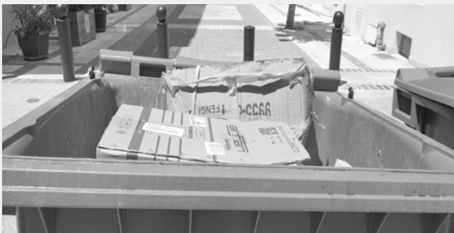
Με 4 κιβώτια γέμισε όλος ο κάδος!

Επειδή γνωρίζω ότι δεν θα κάνετε λογοκρισία στην επιστολή μου, σας τη στέλνω και είναι επιστολή πολλών δημοτών, αλλά εγώ την υπογράφω για λόγους εντοπιότητας και εάν κι εσείς συμφωνείτε με το κείμενο, δεν θα ήθελα να γραφτεί το όνομά μου.