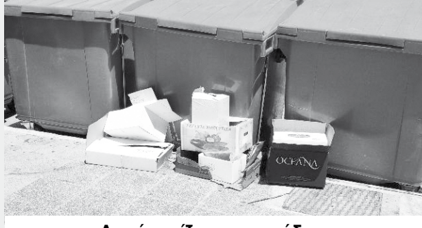
Αφού γεμίζουν τους κάδους... τα πετάνε στα πεζοδρόμια!

Οι καταστηματάρχες - επαγγελματίες της παραλίας εκτός του ότι είναι «αγνώμονες» και φυσικά δεν μιλάμε για όλους, υπάρχουν και εξαιρέσεις, δεν δείχνουν τον ανάλογο επαγγελματισμό στη δουλειά τους και το μόνο που έχουν μάθει είναι να ζητούν εξυπηρέτησεις - παραχωρήσεις από τη δημοτική αρχή και στο τέλος αντί να πουν ευχαριστώ για τα τζάμπα μαγαζιά που τους έκανε, τα θέλουν μονά ζυγά δικά τους.