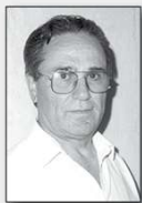
Επιμέλεια: Ιωάννης Παπαγεωργίου

Σημειώνεται ότι η ανάπτυξη θα γίνει με σύγχρονο σχεδιασμό, υλικά και τρόπους εφαρμογής, προκειμένου να οργανωθούν οι υπαίθριοι χώροι και χώροι πρασίνου με όρους βιοκλιματικής αρχιτεκτονικής και να διασφαλισθεί η πλήρης και ασφαλής πρόσβαση και των ΑμεΑ, βάσει σχετικής εκθέσεως που έχει ήδη εκπονηθεί.