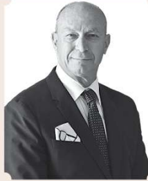
Γεώργιος Γκιωνής ΔΗΜΑΡΧΟΣ