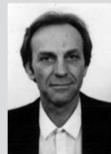
Γράφει ο Δημήτρης Κ. Χρυσούλας

«Μια αδιάκοπη πορεία προς την πρόοδο είναι η Δημοκρατία»