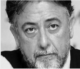
Γράφει ο: ΓΙΑΝΝΗΣ ΠΑΝΟΥΣΗΣ*

Στα ψιλά των εκλογών μπορεί κάποιος να διακρίνει σχέδια προσωπικής επιβίωσης, ευσεβείς πόθους αντικατάστασης φθαρμένων αρχηγών, ημι - χειραφετήσεις από τις κομματικές γραμμές, υπόγεια παιχνίδια [παρα]εξουσίας, σκονισμένα τσιτάτα, αριθμούς κενούς περιχομένου, κράμα από ευχές και κατάρτες. Μέσα σ'έναν πρωτόγνωρο κυλό κομματικών υποψηφιστών κάθε χρώματος και προέλευσης, δίχως ελάχι στο κοινό ιδεολογικό [και ηθικό;] παρονομαστή, πλην της διεκδίκησης της ατομικής ή παρε'ϊκής μικροκαρέκλας[ακόμα και αγώνα για στασίδι], είναι αδύνατο να ξε-χωρίσεις 'ποιός ενσωματώνεται που,ποιός εκμαυλίζει ποιόν':οι οπαδοί τον ηγέτη,ο