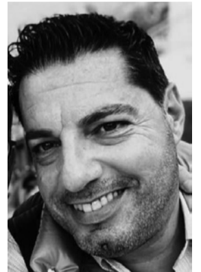
Γράφει ο Πάνος Κοντόπουλος

ΠΑΝΟΣ Κ. ΚΟΝΤΟΠΟΥΛΟΣ ΓΕΝΙΚΟΣ ΟΙΚΟΓΕΝΕΙΑΚΟΣ ΙΑΤΡΟΣ Κ.Υ ΛΟΥΤΡΑΚΙΟΥ-Π.Ι. ΑΛΜΥΡΗΣ