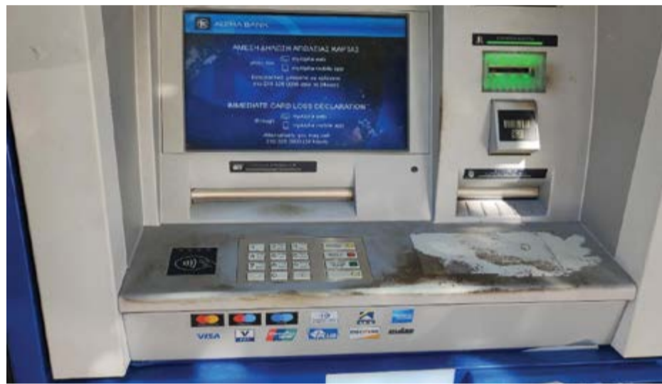
Εστία μόλυνσης το βρώμικο και ρυπαρό ATM της ALFABANK στο Λουτράκι

Γεγονός που προκάλεσε σύμφωνα και με την σελίδα της Boating in Greece που υπάρχει στο Facebook, τις έντονες διαμαρτυρίες των εταιρειών εκμίσθωσης επαγγελματικών σκαφών Ελλάδος, που πλήττονται οικονομικά από αυτή την εξέλιξη, αφού αναγκάζονται είτε να ακυ-