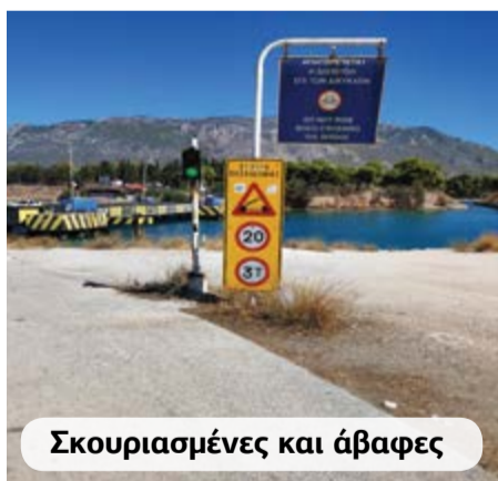
Σκουριασμένες και άβαφες