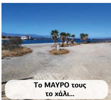
Το ΜΑΥΡΟ τους το χάλι...