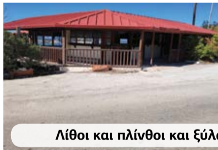
Λίθοι και πλίνθοι και ξύλα κέραμοι άτάκτως έρριμμένα