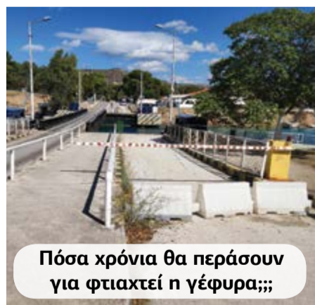
Πόσα χρόνια θα περάσουν για φτιαχτεί η γέφυρα;;;