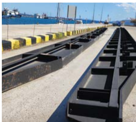
Ποιός είναι για τα σίδερα της Διώρυγας;

Αλήθεια, όλο τον καιρό που η διώρυγα ήταν κλειστή λόγω των γνωστών κατολισθήσεων, η διοίκηση της διώρυγας τι έργο προσέφερε;