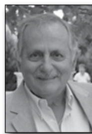
Επιμέλεια: Κώστας Στάμου

μονεύει τις Κεγχρεές και στην προς Ρωμαίους επιστολή του, διότι απέλευσε από εκεί με τους ακολούθους του για την Έφεσο της Μικράς Ασίας δια θαλάσσης. Απέναντι στις Κεγχρεές είναι το λουτρό της Ελένης. Το νερό που βγαίνει από το βράχο και κύνεται στη θάλασσα είναι πολύ σε ποσότητα, αλμυρό στη γεύση και χλιαρό στη θερμοκρασία του. Στο νότιο άκρο του τοξοειδούς κόλπου των Κεγχρεών και σε απόσταση 15-20 λεπτών πεζοπορίας από το νότιο λιμενοβραχίονά του υπάρχει η πηγή του «Λουτρού της Ελένης» στη ρίζα βραχώδους βορειοανατολικής προεκτάσεως των Ονείων Ορέων, που διαχωρίζει τους όρμους των Κεγχρεών και της Αλμυρής. Στην αρχή της χερσονήσου είναι ο οικισμός Λουτρό της Ελένης, 1 χλμ. περίπου νότια των Κεγχρεών στο δρόμο προς την Επίδαυρο. Λίγο πάνω από τη στάθμη του νερού της θάλασσας είναι πηγή με υφάλμυρο νερό, όπου υπάρχουν αρχαίες πέτρες που σχηματίζουν δεξαμενή, από το νερό της οποίας λειτουργούσε άλλοτε ένας νερόμυλος. Το νερό αυτό εθεωρείτο ιαματικό. Στην περιοχή προς τα νοτιοδυτικά του Λουτρού της Ελένης, σε απόσταση 3 χλμ. όπου βρίσκεται το χωριό Γαλατά και τοποθετείται η αρχαία πόλη Σολυγεία, όπου το έτος 425 π.Χ. επήλθε σύγκρουση μεταξύ των επιδραμόντων Αθηναίων και των κατεχόντων τη θέση εκείνη Κορινθίων, με μεγάλες απώλειες από τα δύο μέρη, όπως μας ιστορεί ο αείμνηστος Ιωάννης Β. Βίγλας. Όμως ο Πausanias δεν προχώρησε πέρα από το λουτρό της Ελένης, αλλά έστρεψε τα βήματα της περιηγήσεώς του δυτικά των Κεγχρεών προς την Κόρινθο.