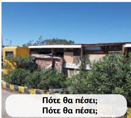
Πότε θα πέσει; Πότε θα πέσει;