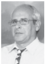
Γράφει ο Β. Βεκούσης

Με όσα έχουν δει το φως της δημοσιότητας σχετικά με την οικονομική κρίση στην Ελλάδα μας, στους πολλούς πολίτες υπάρχει το ερώτημα: Σωστά η κυβέρνηση Γ. Παπανδρέου το 2010 παράδωσε την Ελλάδα μας στο Δ.Ν.Τ. και την Ε.Ε.; Ως γνωστόν, στην αρχή μάς έλεγαν "λεφτά υπάρχουν". Αργότερα "πού πήγαν τα λεφτά". Ξαφνικά ανακάλυψαν άδεια ταμεία, φουσκωμένα ελλείμματα κ.ά. Πότε άραγε έλεγαν αλήθειες; Εγκατέλειψαν τις κόκκινες γραμμές, κούρεψαν συντάξεις - μισθούς - δώρα - επιδόματα - εφάπαξ - φοροαπαλλαγές - καταθέσεις - αποταμιεύσεις - κοινωνικές παροχές, ψήφισαν χαράτσια, για να βρουν τα λεφτά με το σόφισμα "μαζί τα φάγαμε". Όμως με αυτά κι αυτά, τα όνειρα και οι ελπίδες μιας ολόκληρης ζωής των πολλών πολιτών αυτής της χώρας, κ.κ. της πολιτικής εξουσίας, χάθηκαν. Και η αντιπολίτευση του 2010 στο Ζάππειο 1-2-3 μιλούσε για επαναδιαπραγμάτευση, επανεκκίνηση της οικονομίας, για έρευνα