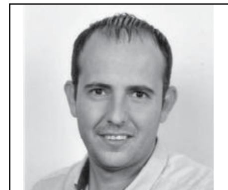
ΠΑΝΤΕΛΕΟΥ: ΔΕΝ ΑΠΟΔΕΧΟΜΑΙ ΤΗΝ ΘΕΣΗ ΤΟΥ ΑΝΤΙΔΗΜΑΡΧΟΥ