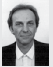
Γράφει ο Δημήτρης Κ. Χρυσούλας

«Η αλαζονεία της εξουσίας δημιουργεί τραγωδίες»... - Σύμπλεγμα ανωτερότητας και υπεραιμίας και ανάλογη συμπεριφορά του ανθρώπου, ο οποίος θεωρεί και παρουσιάζει τον εαυτό του σπουδαιότερο από τους άλλους κι απ' ό,τι πράγματι είναι: π.χ. Ερντογάν - Πούτιν. Η αλαζονεία δημιουργεί από καταβολής του κόσμου έως σήμερα τους δικτάτορες και τους τυράννους. • Όταν ο Μ. Αλέξανδρος ανάρρωσε από βαριά αρρώστια, είπε: «Δεν έπαθα τίποτα, γιατί η αρρώστια με δίδαξε να μην είμαι αλαζόνας, αφού είμαι θνητός»... Η αλαζονεία είναι μια συνήθεια υποκριτική, όταν δεν υπάρχουν χρήσιμα έργα συνετά, δημιουργικά. • Τους ασκούς τους φουσκώνει ο αέρας, τους ανόητους ανθρώπους η αλαζονεία, μας λέει ο Σωκράτης. • Και ο Ηράκλειτος προσθέτει: Πρέπει πιο πολύ να σβήνουμε την αλαζονεία, παρά την πυρκαγιά!.. Ο αλαζόνας νομίζει πως ο Θεός δεν έκανε κανέναν άλλον μεγαλύτερο απ' αυτόν, λέει ο Ηρόδοτος... Η αλαζονεία είναι σίγουρα εμπόδιο, προς τη σύνεση και τη σοφία. Μην υπερηφανεύεσαι πολύ για να μην τιμωρηθείς πολύ. Η αλαζονεία μας φθείρει την αγνότητα και κάθε θετική αξία στη ζωή μας... Απλά είναι τα λόγια της αλήθειας- Αγάπη! Εύχομαι η δύναμη της αγάπης του Θεού να σας συντροφεύουν. Δια βίου «Ο μωρός πιστεύει ότι είναι σοφός»!..