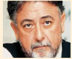
Γράφει ο: ΓΙΑΝΝΗΣ ΠΑΝΟΥΣΗΣ*

Στ.Σταυρόπουλος, Θα σε δω ξανά στο άδοξο τέλος