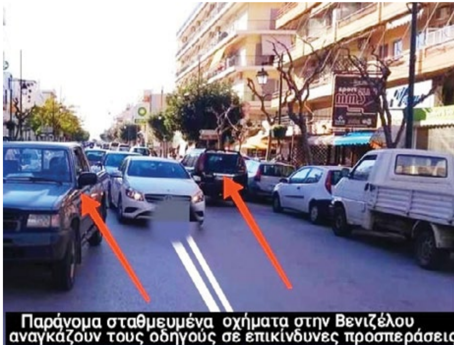
Παράνομα σταθμευμένα οχήματα στην Βενιζέλου αναγκάζουν τους οδηγούς σε επικίνδυνες προσπεράσεις

Περισσότερο, απ' ό,τι γνωρίζουμε, έχουν συλλεχθεί προς τον σκοπό αυτό και εκατοντάδες υπογραφές δημοτών, που αι-