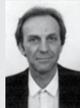
Γράφει ο Δημήτρης Κ. Χρυσούλας

Εύχομαι να περάσουν οι δίσεκτοι καιροί παρακμής. Ο Θεός να βοηθήσει την επιβίωση του ανθρώπινου γένους με ειρήνη!..