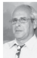
Γράφει ο Β. Βεκούσης

«Κανείς δεν είναι τόσο ανόητος, ώστε να προτιμάει τον πόλεμο από την ειρήνη» και ως σήμερα οι λαοί δεν μπορούν να αδελφωθούν ώστε να βάλουν ένα τέλος στη φρίκη του πολέμου.