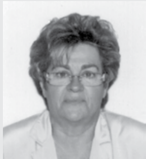
Επιμέλεια: Αλεξάνδρα Μαυροπούλου