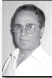
Επιμέλεια: Ιωάννης Παπαγεωργίου

Ο Έλληνας όταν είναι πεζός, του φταίει οι οδηγοί των αυτοκινήτων, επειδή δεν τον αφήνουν να διασχίζει κάθεται και διαγώνια τους δρόμους. Κι όταν ο ίδιος είναι οδηγός, του φταίει οι πεζοί γιατί κατεβαίνουν από τα πεζοδρόμια στις διαβάσεις πεζών και αναγκάζονται να ελαττώνουν ταχύτητα.