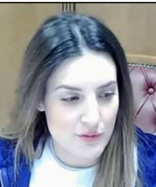
ΓΥΝΑΙΚΑ ΠΡΟΕΔΡΟΣ ΣΤΟ ΔΗΜΟΤΙΚΟ ΣΥΜΒΟΥΛΙΟ ΤΟΥ ΔΗΜΟΥ ΜΑΣ