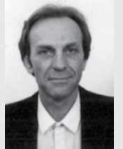
Γράφει ο Δημήτρης Κ. Χρυσούλας

Εύχομαι η σωφροσύνη και η αγάπη να σας συντροφεύει «δια βίου»... Ο καλός θεός να βοηθήσει