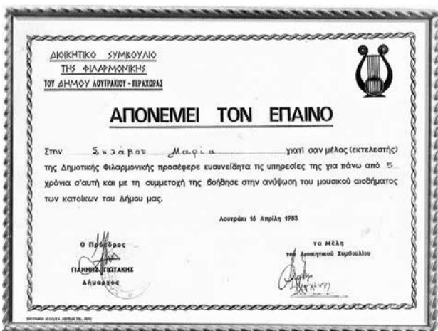
Έπιτιλος (Μαρίας Σκλαβου)