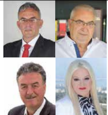
ΑΠΑΝΤΗΣΕΙΣ ΤΩΝ ΣΥΝΔΙΑΣΜΩΝ ΣΧΕΤΙΚΑ ΜΕ ΤΗΝ ΕΝΟΙΚΙΑΣΗ ΤΟΥ ΣΠΑ

αντιπολίτευση για την αντιπολίτευση. Αγαπητοί αναγνώστες, το ΣΠΑ Λουτρακίου δυστυχώς από την ημέρα που άνοιξε ήταν μια επιχείρηση που κάθε μήνα έμπαινε μέσα, κατά το κοινώς λεγόμενο. Ο εργολάβος, που του χρωστούσαμε χρήματα, «έπαιξε» με το Δήμο, κάνοντας συνεχώς κατασχέσεις, αμαυρώνοντας το ΣΠΑ και κατ' επέκταση και ολόκληρο το Δήμο και τους δημοτικούς συμβούλους. Και ρωτάμε με απλά ελληνικά: Όταν μια επιχείρηση σε βάζει μέσα και ιδιαίτερα όταν είναι δημοτική επιχείρηση, τι πρέπει να κάνεις; Να παίρνεις χρήματα από το ταμείο του Δήμου, με τον έναν και τον άλλον τρόπο για να το συντηρείς; Και όταν τα χρήματα είναι των δημοτών; ΟΧΙ, κοιτάς πώς να το βγάλεις από πάνω σου με ευνοϊκούς όρους για το Δήμο. Στην προκειμένη περίπτωση, από τη στιγμή που υπάρχουν τρεις ενδιαφερόμενοι για την ενοικίασή του, δεδομένης και της δυνατότητας του διεθνούς διαγωνισμού για την ενοικίασή του, ΕΠΡΕΠΕ ΧΘΕΣ να είχαν ξεκινήσει όλες οι νόμιμες διαδικασίες της ενοικίασης. Όλα τα άλλα είναι άλλα λόγια να αγαπιόμαστε. Υ.Γ.1 Να ενημερώσουμε ότι όλοι οι εργαζόμενοι στο ΣΠΑ Λουτρακίου θα απορροφηθούν από τον Δήμο Λουτρακίου βάση του σχετικού νόμου. Υ.Γ.2 Το ποσό που πλήρωνε ο Δήμος κάθε χρόνο από την χασούρα την οικονομική για το ΣΠΑ ήταν 1 εκατ. 300 χιλ. ευρώ. Υ.Γ.3 Μήπως πρέπει να ζητηθούν ευθύνες από τους δημάρχους και τα δημοτικά συμβούλια για τα τελευταία δέκα χρόνια, διότι σύμφωνα με τα στοιχεία αν αληθεύουν σημαίνει 13 εκατ. ευρώ που έχει πληρώσει ο Δήμος.