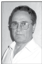
Επιμέλεια: Ιωάννης Παπαγεωργίου

Η οικογένεια είναι ομάδα ανθρώπων που κατά κανόνα ζει κάτω από την ίδια στέγη και συνδέεται με δεσμά αίματος. Αποτελείται από τον πατέρα, τη μάνα, τα παιδιά - αδέρφια - που προέκυψαν από την ευλογημένη συνύπαρξη του ζεύγους.