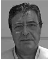
Επιμέλεια-Έρευνα: Σ. Γιαλοψός

από την διεύθυνση της εταιρίας, όσο και από τους εκατοντάδες τουρίστες. Τα θεμέλια της Δημοτικής Φιλαρμονικής σαν Πολιτιστικός φορέας στην πόλη μας μπήκαν πολύ γερά γράφοντας την δική της ιστορία. Αυτό επιβεβαιώνεται άλλωστε και από γεγονός της συμμετοχής (μετά από πρόσκληση) στο κατάμεστο Ολυμπιακό στάδιο (ΟΑΚΑ) στις 19 Σεπτέμβρη στην ιστορική συναυλία του που έδωσε (ο πρωτεργάτης των Ελληνων τραγουδοποιών) Διονύσης Σαββόπουλος. Η Δημοτική μας Φιλαρμονική άνοιξε την συναυλία παιανίζοντας στην παρέλαση στην είσοδο των καλλιτεχνών στο στάδιο [Μαέστρος της Φιλαρμονικής ήταν τότε ο Λευτέρης Δαρζέντας (συνεργά της στις ενορχηστρώσεις & στη Δ/ση Μπάντας του αείμνηστου Λουκιανού Κηλαδόνη)] (υπάρχει και ηχογραφήματα όπου αναγγέλλεται στο στάδιο η είσοδος της Δημοτικής Φιλαρμονικής Λουτρακίου).